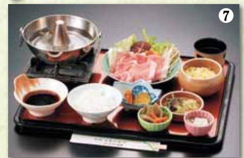
⑦しゃぶしゃぶ定食 1,500円