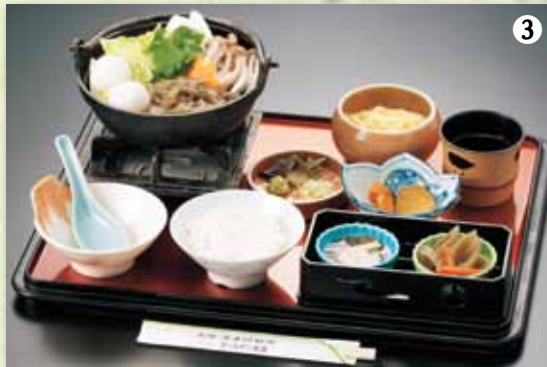
③黄金じゅんさい鍋御膳 1,200円