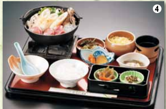
④黄金きりたんぽ鍋御膳 1,500円