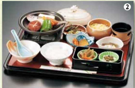
②陶板焼はたはた御膳 1,200円