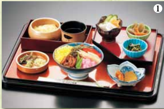
①金山ちらし定食 1,000円